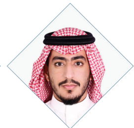
سمو الامير/ سعود بن عبدالله آل سعود شركة مجموعة الاطلام