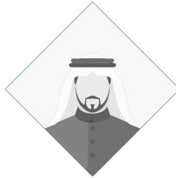
الأستاذ/ أحمد يوسف مجوم شركة مصنع مجوم للأدوية